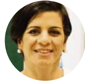
Vivian Eljaiek Presidenta de la Asociación Nacional de Empresarios de Colombia (Andi) en Bolívar

“Creo en el Caribe, en su autonomía y en darle un mayor valor a lo humano. Por eso debemos ir más allá de un acto político y darle continuidad y fuerza a la unión de la Región, darle más garras normativas y jurídicas”.