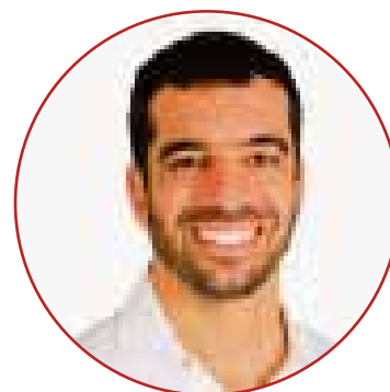
Senador Arturo Char

Aseguremos primero que esto va a funcionar”, expresa María del Rosario Guerra. La senadora ve la RAP como un paso importante para mejorar problemáticas esenciales. Pero, es consciente que hay que esperar que sucede con esta importante iniciativa.