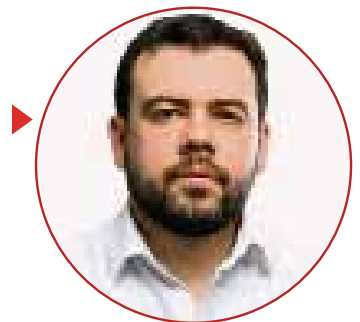
Senador Carlos Fernando Galán

“La impresión que yo tengo sobre la RAP es que es una gran oportunidad de planificación del territorio, una gran oportunidad para dejar de poner el sombrero en Bogotá y organizarnos para sacar de la pobreza a nuestros compatriotas del Caribe y que vuelvan sentir el orgullo Caribe. Pero también es la oportunidad de organizar la RAP porque una cosa fue lo que sucedió el 19 de octubre y otra es la actual. Hoy día ya está firmada, ahora tenemos otro paso que dar que nombrar un director administrativo que sea una persona que conozca los procedimientos y que se dé la pela por sacarlo adelante. Dos, tenemos que tener una sede para que el Presidente o el que viene nos miren como verdaderamente necesitamos que nos miren. Y tres, la unidad de los gobernadores significaría que estos tienen la obligación de rescatar la voluntad política, económica y social y la credibilidad que el Caribe perdió. Entonces la visión clara es dejar de mendigar con la responsabilidad de tener excelentes administradores para poder sacar adelante la Región”.