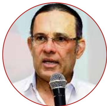
Senador Efraín Cepeda Sarabia

“En Colombia no existe la descentralización sino la re-centralización, que ha sido la culpable del desempleo y altísimo índice de informalidad, además de las indignas rogativas de nuestros gobernadores y alcaldes ante el poder central para obtener recursos. Hoy reclamamos ser los protagonistas de nuestro propio destino y de las causas sociales. La RAP Caribe contribuirá a dar vida al artículo 306 de nuestra Constitución y garantizándonos la “personería jurídica, autonomía y patrimonio propio.”