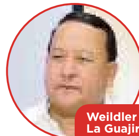
Weildler Guerra La Guajira