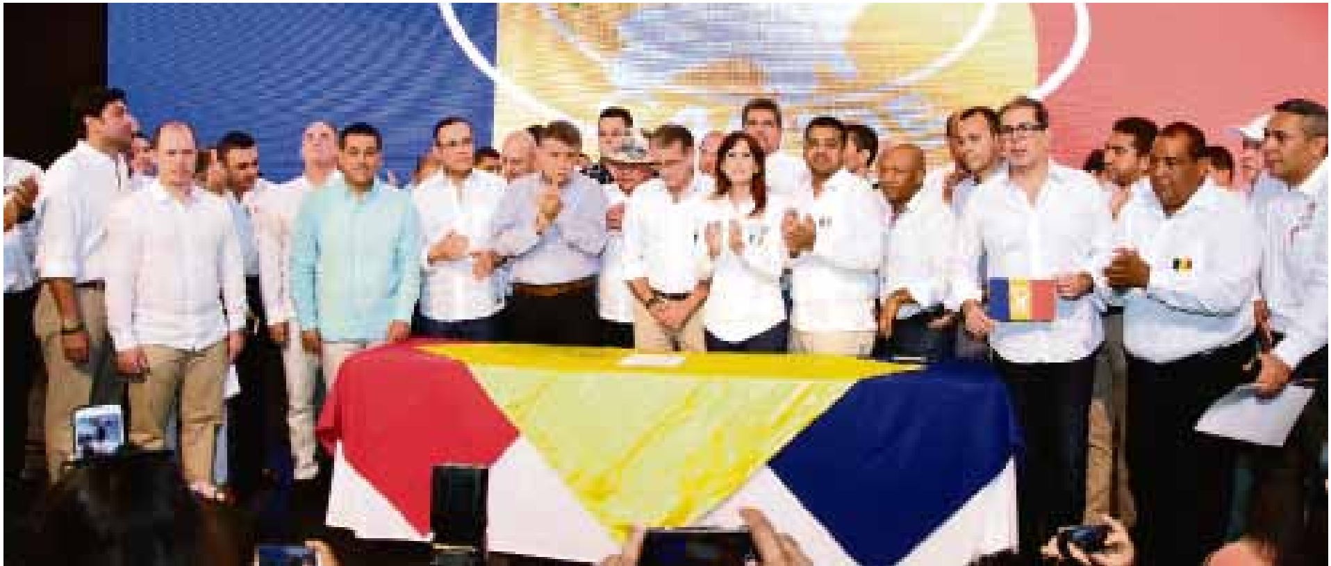
El evento histórico de la firma de la RAP, el 19 de octubre de 2017 en la Gobernación del Atlántico, ha sido antecedido por todo un camino de acontecimientos.