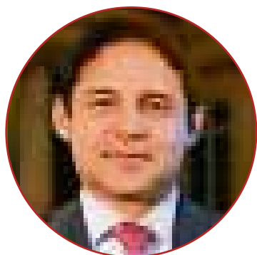
Senador Honorio Miguel Henríquez

“En Colombia no existe la descentralización sino la re-centralización, que ha sido la culpable del desempleo y altísimo índice de informalidad, además de las indignas rogativas de nuestros gobernadores y alcaldes ante el poder central para obtener recursos. Hoy reclamamos ser los protagonistas de nuestro propio destino y de las causas sociales. La RAP Caribe contribuirá a dar vida al artículo 306 de nuestra Constitución y garantizándonos la “personería jurídica, autonomía y patrimonio propio.”