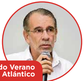
Eduardo Verano Atlántico