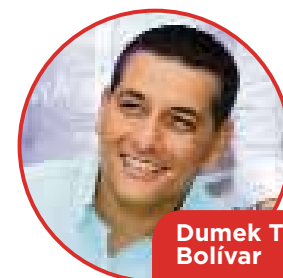
Dumek Turbay Bolívar

Se refirió también a una de sus propias batallas libradas, el Voto Caribe, que ganó en aceptación pero sin ninguna incidencia jurídica, el 14 de marzo de 2010, cuando 2,5 millones de ciudadanos lo apoyaron, lo que “demuestra que el talante Caribe tiene la fuerza necesaria para avanzar”.