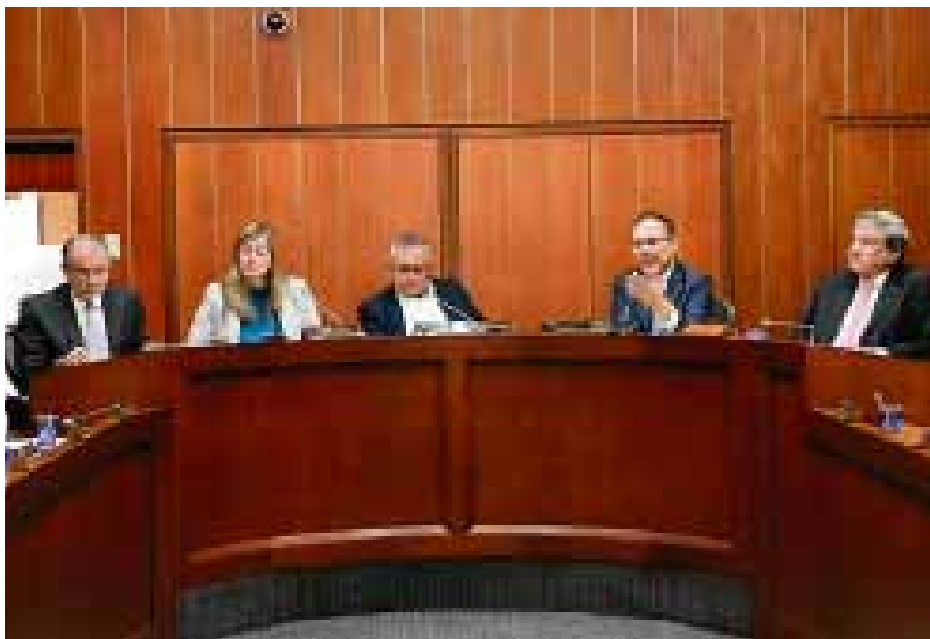
Por unanimidad, la Comisión de Ordenamiento Territorial del Senado aprobó la creación de la Región Administrativa de Planeación del Caribe, RAP Caribe.