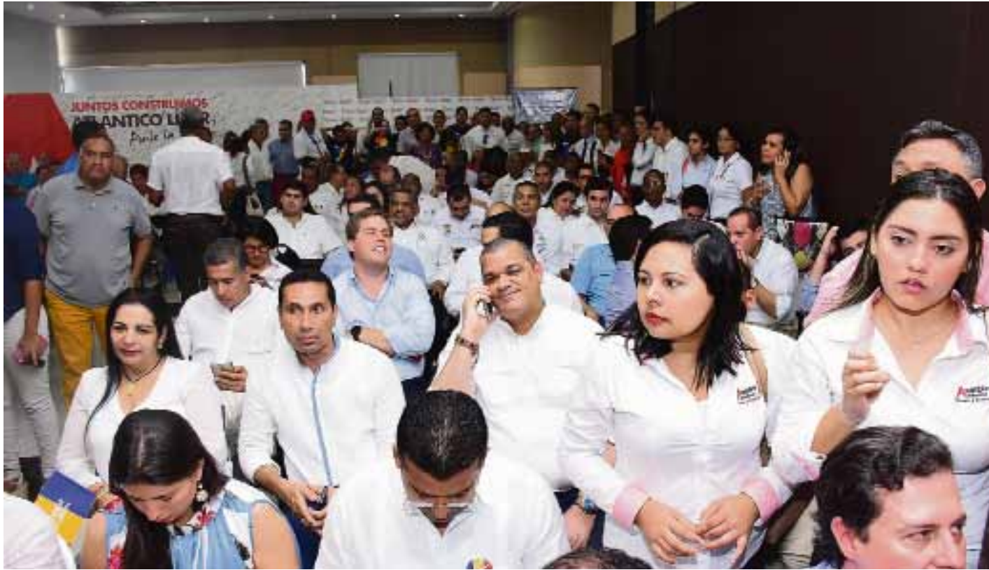
Personal asistente al acto de firma del documento RAP Caribe escucha atentamente los alcances de la iniciativa.

se abrían las puertas a una descentralización al poder elegir a su máxima autoridad departamental.